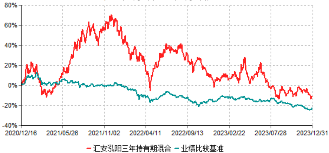
汇安泓阳三年持有期混合型证券投资基金累计净值增长率与业绩比较基准收益率历史走势对比图 (2020年12月16日-2023年12月31日)