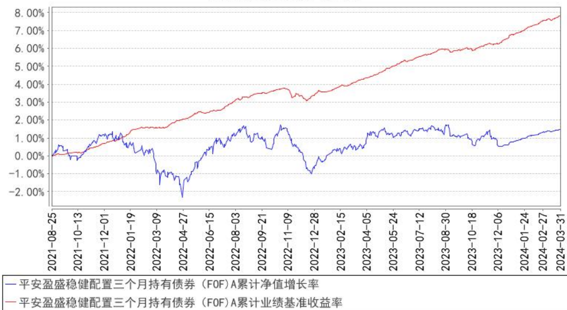
平安盈盛稳健配置三个月持有债券（FOF）A累计净值增长率与同期业绩比较基准收益率的历史走势对比图