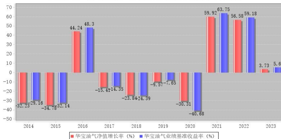
华宝油气每年净值增长率与同期业绩比较基准收益率的对比图