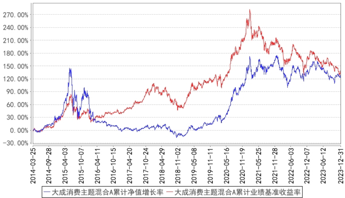
大成消费主题混合A累计净值增长率与同期业绩比较基准收益率的历史走势对比图

(二) 自基金合同生效以来基金份额累计净值增长率变动及其与同期业绩比较基准收益率变动的比较