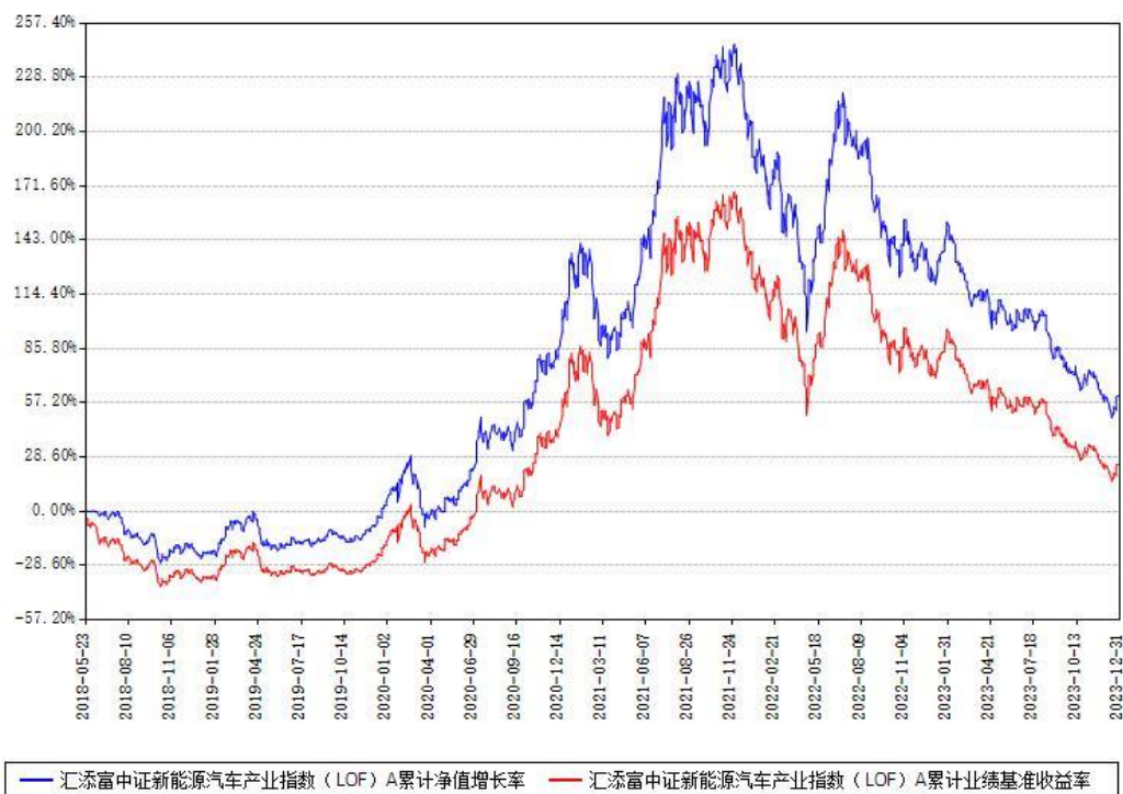
汇添富中证新能源汽车产业指数（LOF）A 累计净值增长率与同期业绩比较基准收益率对比图