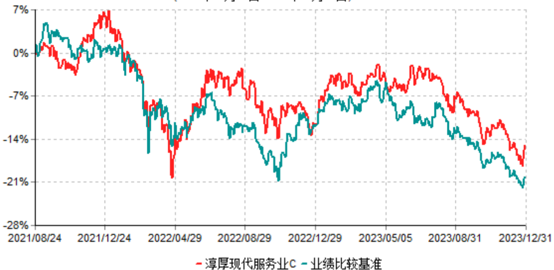
淳厚现代服务业C累计净值增长率与业绩比较基准收益率历史走势对比图 (2021年08月24日-2023年12月31日)

注：本基金基金合同生效日为2021年08月24日。按基金合同规定，本基金自基金合同生效起6个月内为建仓期。建仓期结束时本基金的各项投资比例均符合基金合同约定。