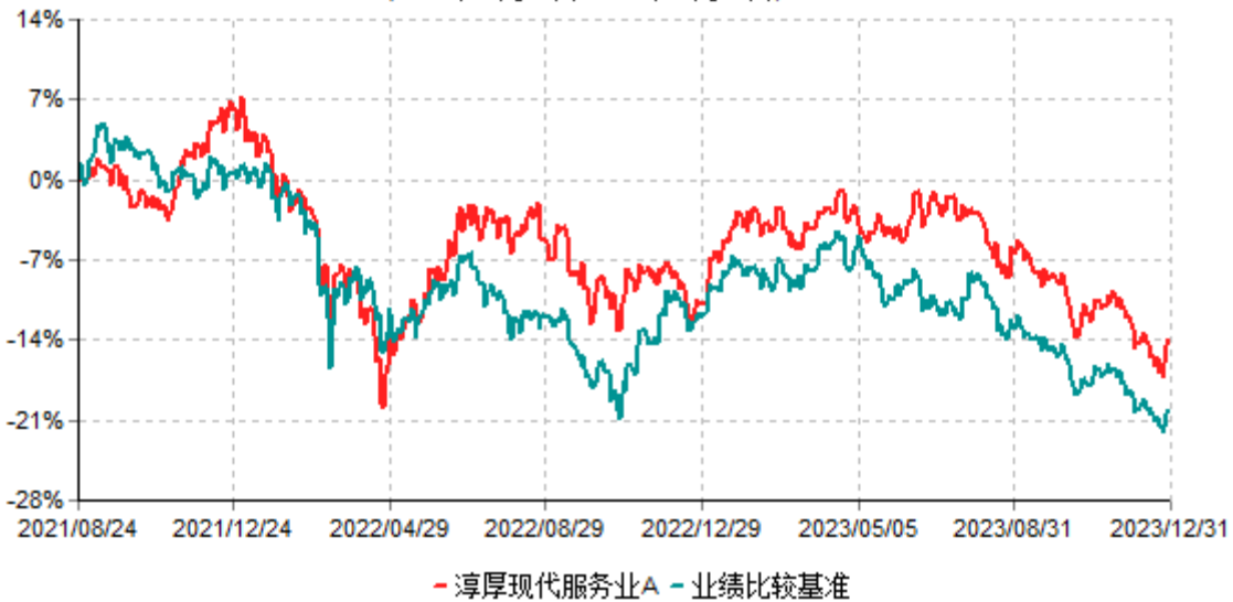
淳厚现代服务业A累计净值增长率与业绩比较基准收益率历史走势对比图 (2021年08月24日-2023年12月31日)

注：本基金基金合同生效日为2021年08月24日。按基金合同规定，本基金自基金合同生效起6个月内为建仓期。建仓期结束时本基金的各项投资比例均符合基金合同约定。