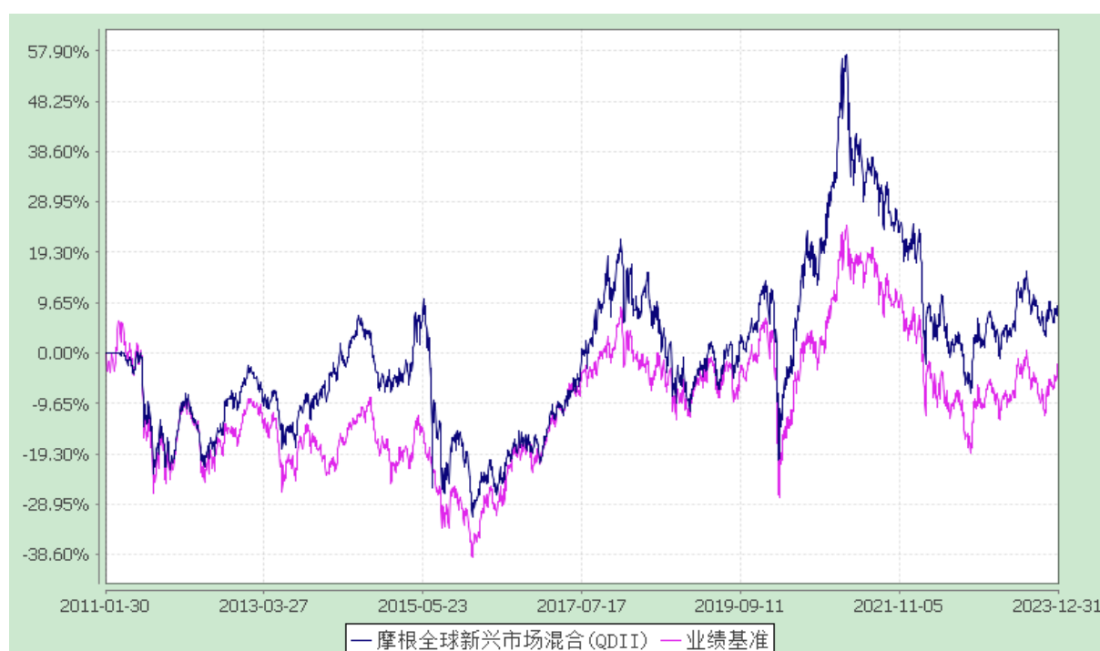
摩根全球新兴市场混合型证券投资基金(QDII) 自基金合同生效以来份额累计净值增长率与业绩比较基准收益率历史走势对比图 (2011年1月30日至2023年12月31日)

注：本基金合同生效日为2011年1月30日，图示的时间段为合同生效日至本报告期末。