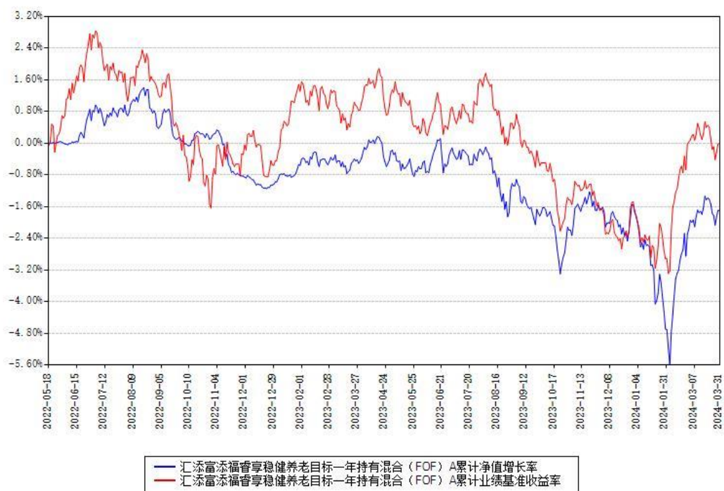
汇添富添福睿享稳健养老目标一年持有混合 (FOF) A 累计净值增长率与同期业绩基准收益率对比图