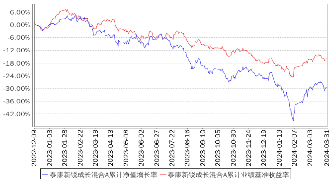
泰康新锐成长混合A累计净值增长率与同期业绩比较基准收益率的历史走势对比图