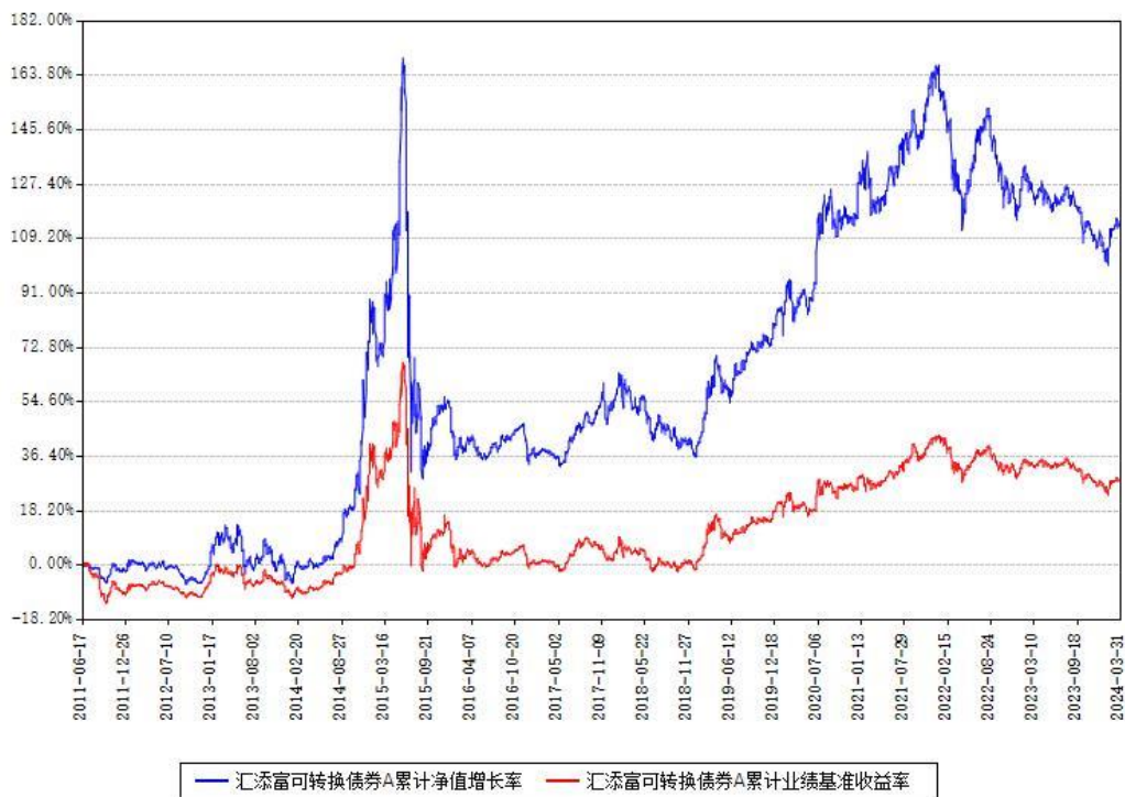
汇添富可转换债券A累计净值增长率与同期业绩基准收益率对比图