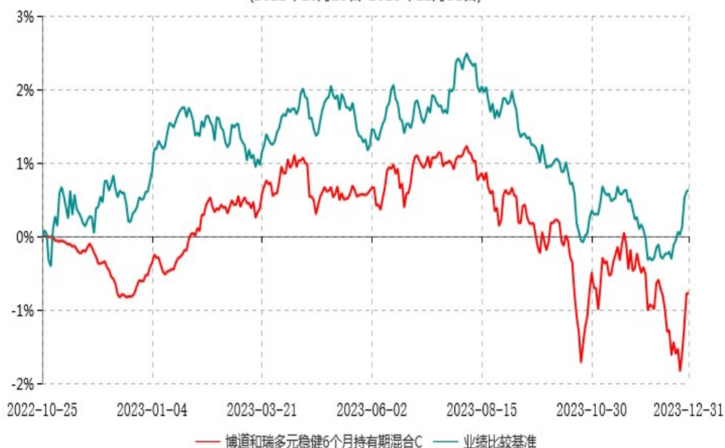
博道和瑞多元稳健6个月持有期混合C累计净值增长率与业绩比较基准收益率历史走势对比图 (2022年10月25日-2023年12月31日)

注：本基金基金合同生效日为2022年10月25日，建仓期为自基金合同生效日起的6个月。截至报告期期末，本基金已完成建仓但报告期期末距建仓结束未满一年。截至建仓期结束，本基金各项资产配置比例符合基金合同及招募说明书有关投资比例的约定。