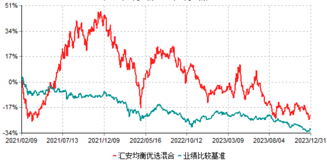
汇安均衡优选混合型证券投资基金累计净值增长率与业绩比较基准收益率历史走势对比图 (2021年02月09日-2023年12月31日)