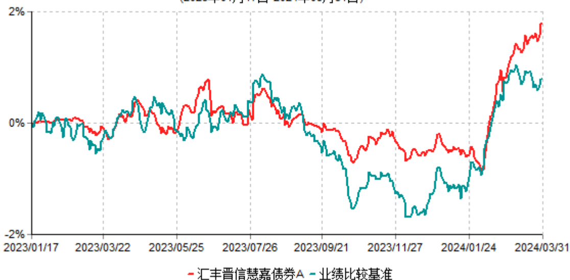
汇丰晋信慧嘉债券A累计净值增长率与业绩比较基准收益率历史走势对比图 (2023年01月17日-2024年03月31日)