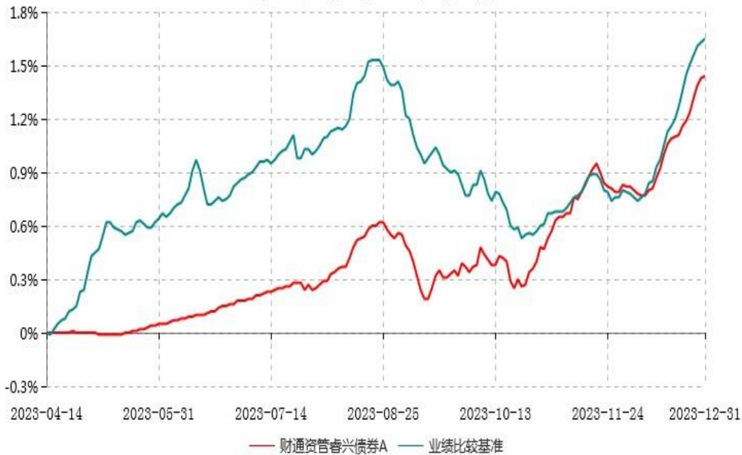
财通资管睿兴债券A累计净值增长率与业绩比较基准收益率历史走势对比图 (2023年04月14日-2023年12月31日)