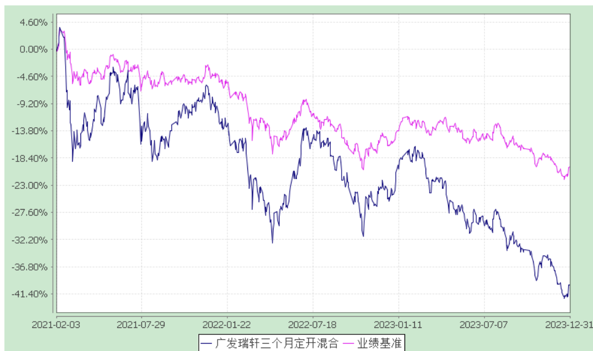
广发瑞轩三个月定期开放混合型发起式证券投资基金 份额累计净值增长率与业绩比较基准收益率的历史走势对比图 (2021年2月3日至2023年12月31日)