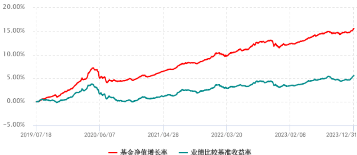
基金份额累计净值增长率与同期业绩比较基准收益率历史走势对比图 (2019年07月18日-2023年12月31日)

注：1、本基金成立于 2019 年 7 月 18 日；2、本基金的业绩比较基准：中债综合全价（总值）指数收益率。