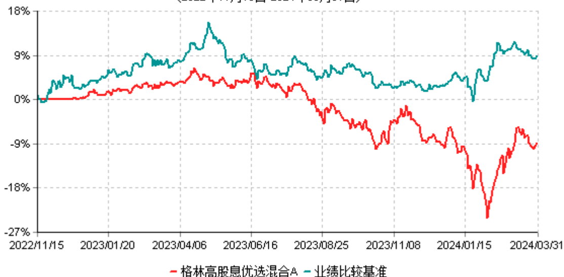
格林高股息优选混合A累计净值增长率与业绩比较基准收益率历史走势对比图 (2022年11月15日-2024年03月31日)