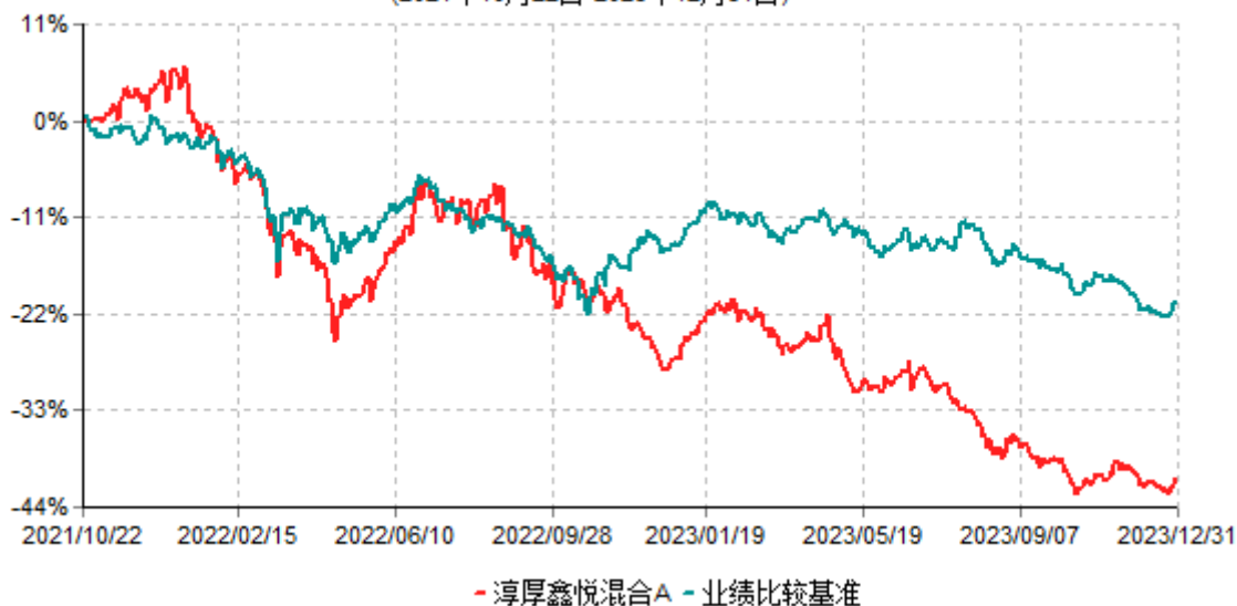
淳厚鑫悦混合A累计净值增长率与业绩比较基准收益率历史走势对比图 (2021年10月22日-2023年12月31日)

注：本基金基金合同生效日为2021年10月22日。按基金合同规定，本基金自基金合同生效起6个月内为建仓期。建仓期结束时本基金的各项投资比例均符合基金合同约定。