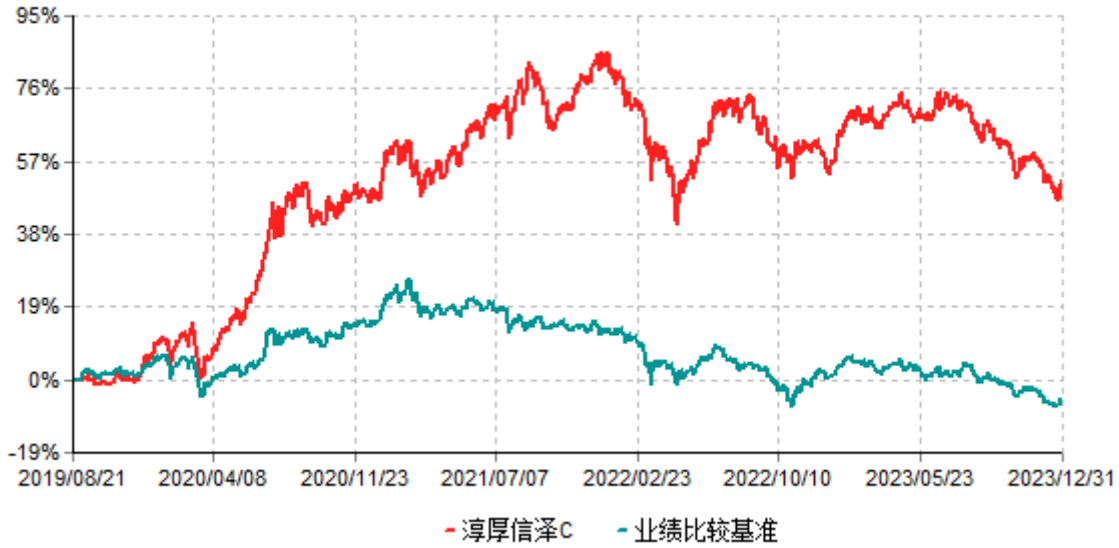
淳厚信泽C累计净值增长率与业绩比较基准收益率历史走势对比图 (2019年08月21日-2023年12月31日)

注：本基金基金合同生效日为2019年8月21日。按基金合同约定，本基金自基金合同生效起6个月内为建仓期。建仓期结束时本基金的各项投资比例均符合基金合同约定。