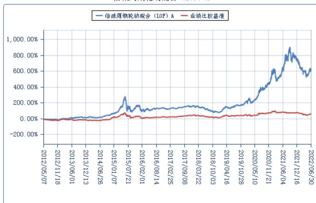
信诚周期轮动混合（LOF）C