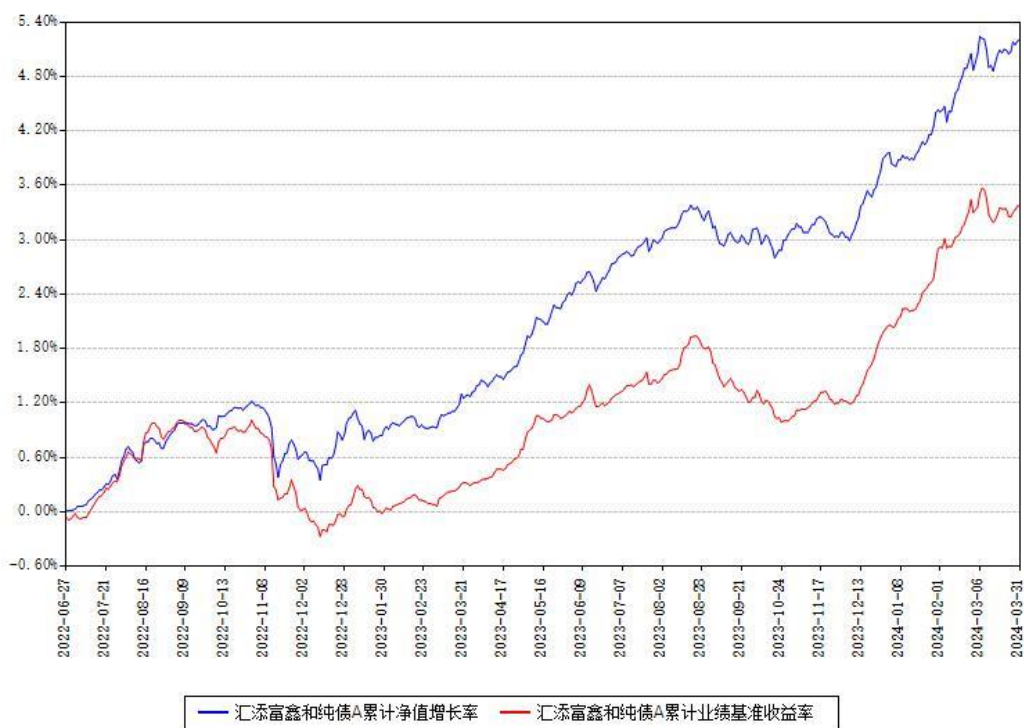
汇添富鑫和纯债A累计净值增长率与同期业绩基准收益率对比图

(二)自基金合同生效以来基金累计净值增长率变动及其与同期业绩比较基准收益率变动的比较图