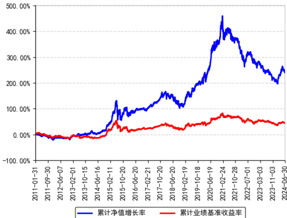
南方优选成长混合A累计净值增长率与同期业绩比较基准收益率的历史走势对比图