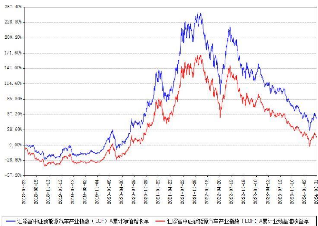
汇添富中证新能源汽车产业指数（LOF）A累计净值增长率与同期业绩基准收益率对比图