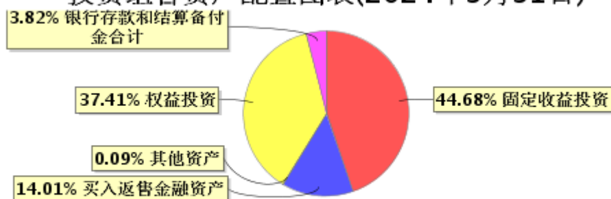
投资组合资产配置图表(2024年3月31日)

● 固定收益投资 ● 买入返售金融资产 ● 其他资产 ● 权益投资 ● 银行存款和结算备付金合计