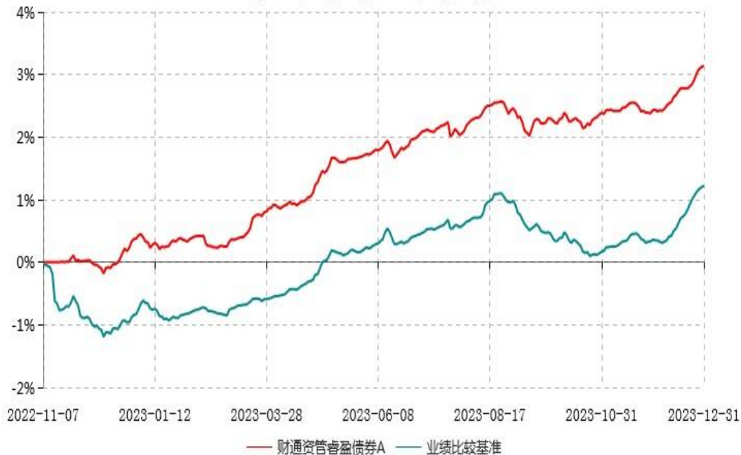
财通资管睿盈债券A累计净值增长率与业绩比较基准收益率历史走势对比图 (2022年11月07日-2023年12月31日)