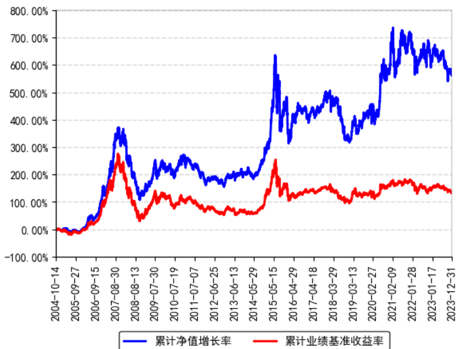
南方积极配置混合（LOF）累计净值增长率与同期业绩比较基准收益率的历史走势对比图