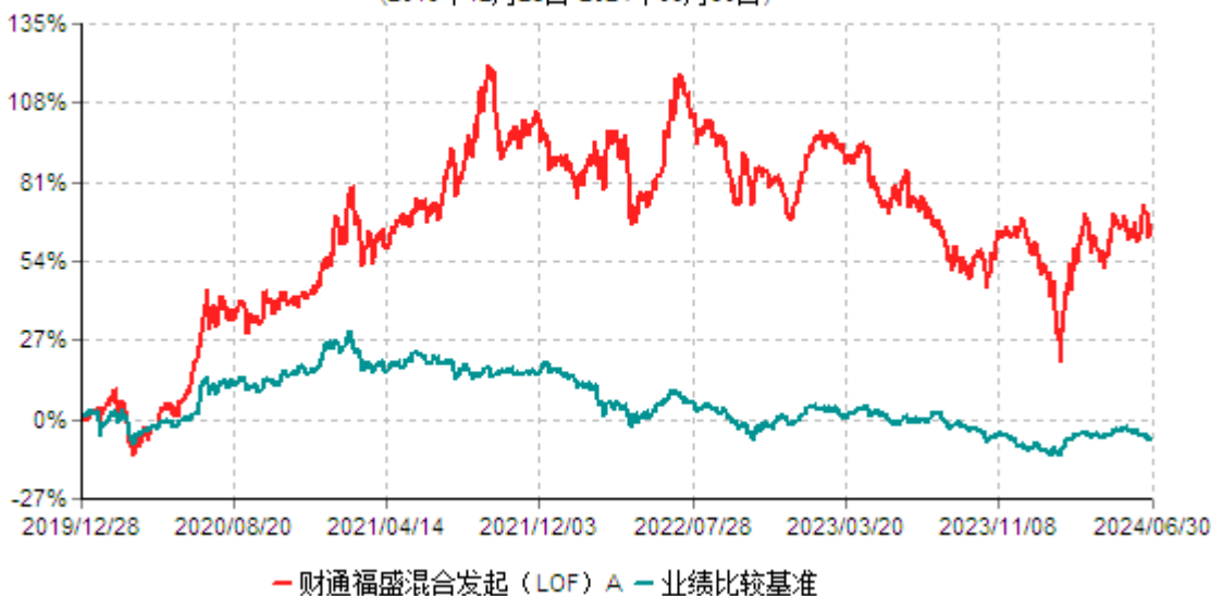
财通福盛混合发起（LOF）A累计净值增长率与业绩比较基准收益率历史走势对比图 (2019年12月28日-2024年06月30日)