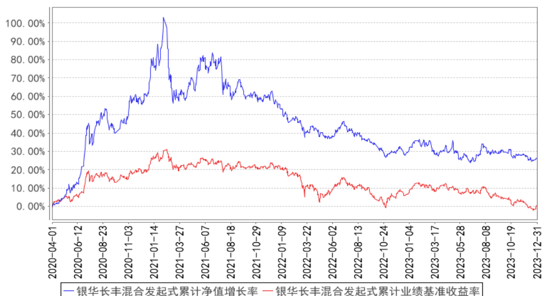
银华长丰混合发起式累计净值增长率与同期业绩比较基准收益率的历史走势对比图

注：按基金合同规定，本基金自基金合同生效起六个月内为建仓期，建仓期结束时本基金的各项投资比例已达到基金合同的规定：股票资产占基金资产的比例为 60%—95%（其中投资于国内依法发行上市的股票的比例占基金资产的 60%—95%，投资于港股通标的股票的比例占股票资产的 0%—50%）。其余资产投资于债券、资产支持证券、债券回购、银行存款（包括协议存款、定期存款及其他银行存款）、现金、股指期货等金融工具；每个交易日日终在扣除股指期货和国债期货合约需缴纳的交易保证金后，现金或者到期日在一年以内的政府债券不低于基金资产净值的 5%，其中，现金不包括结算备付金、存出保证金和应收申购款等。本基金将港股通标的股票投资的比例下限设为零，本基金可根据投资策略需要或不同配置地市场环境的变化，选择将部分基金资产投资于港股通标的股票或选择不将基金资产投资于港股通标的股票，基金资产并非必然投资港股通标的股票。