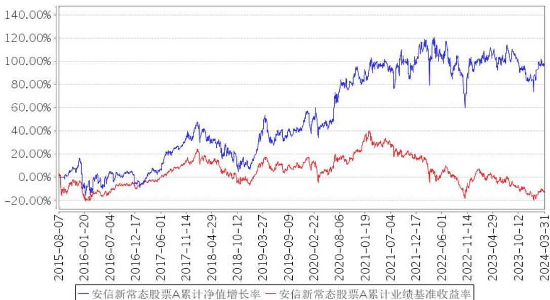
安信新常态股票A累计净值增长率与同期业绩比较基准收益率的历史走势对比图