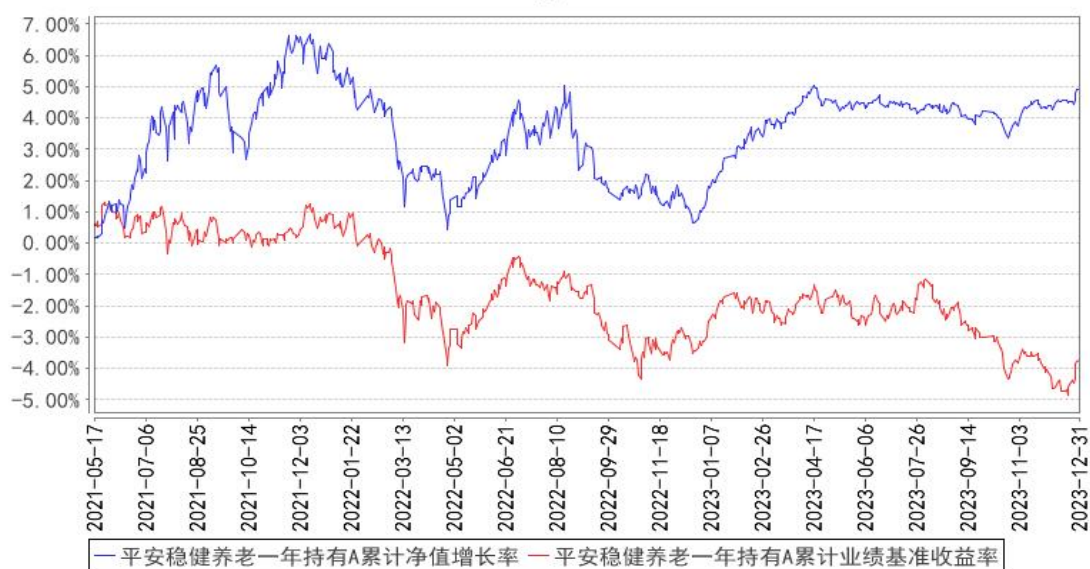
平安稳健养老一年持有A累计净值增长率与同期业绩比较基准收益率的历史走势对比图