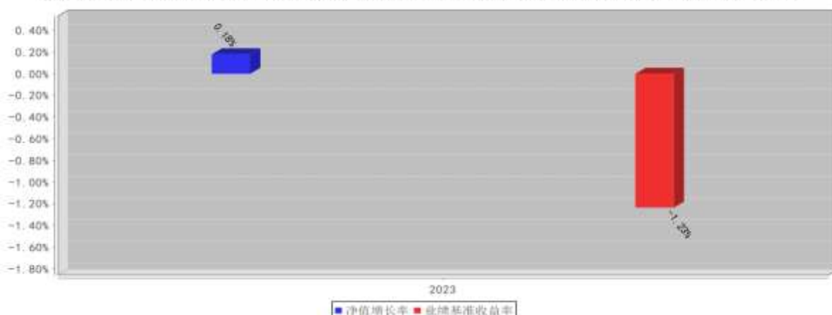
兴证全球招益债券C基金每年净值增长率与同期业绩比较基准收益率的对比图（2023年12月31日）

注：1、2023年数据统计期间为2023年07月05日（基金合同生效日）至2023年12月31日，数据按实际存续期计算，不按整个自然年度进行折算。