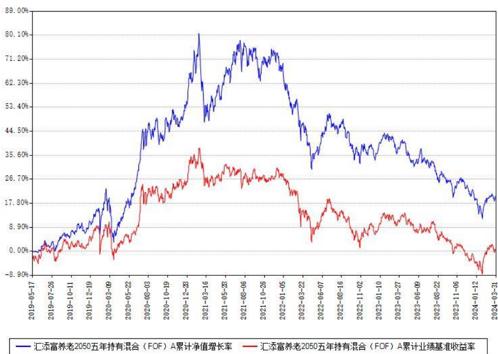
汇添富养老2050五年持有混合 (FOF) A 累计净值增长率与同期业绩基准收益率对比图

(二) 自基金合同生效以来基金累计净值增长率变动及其与同期业绩比较基准收益率变动的比较图