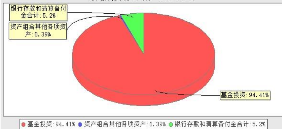
华宝上证180价值交易型开放式指数证券投资基金联接基金投资组合资产配置图 表(数据截止日期: 20240331)