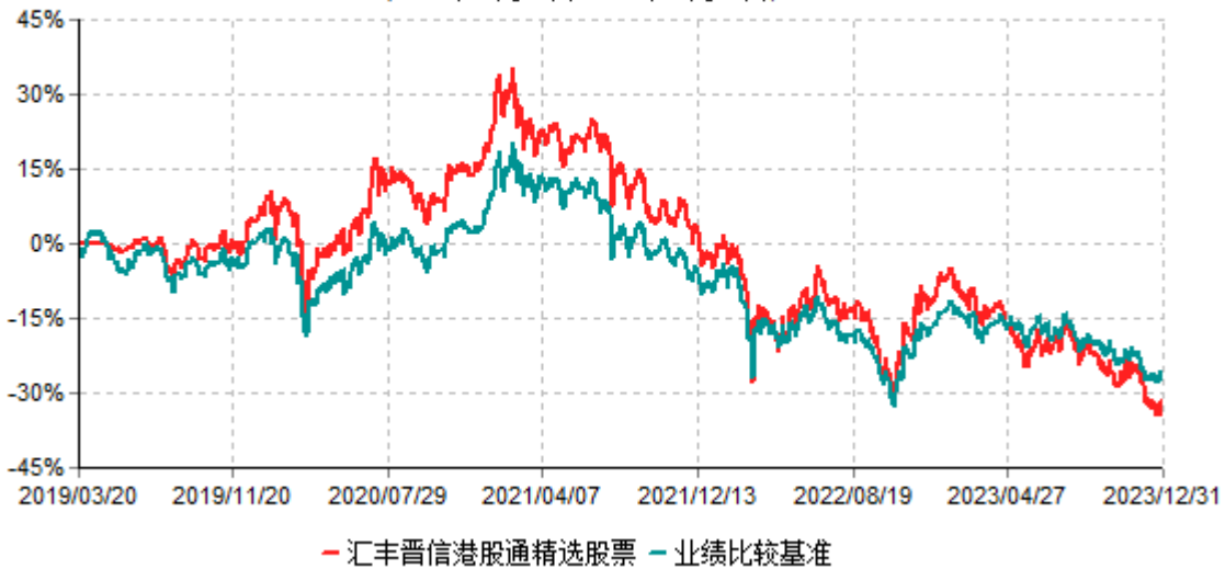
汇丰晋信港股通精选股票型证券投资基金累计净值增长率与业绩比较基准收益率历史走势对比图 (2019年03月20日-2023年12月31日)