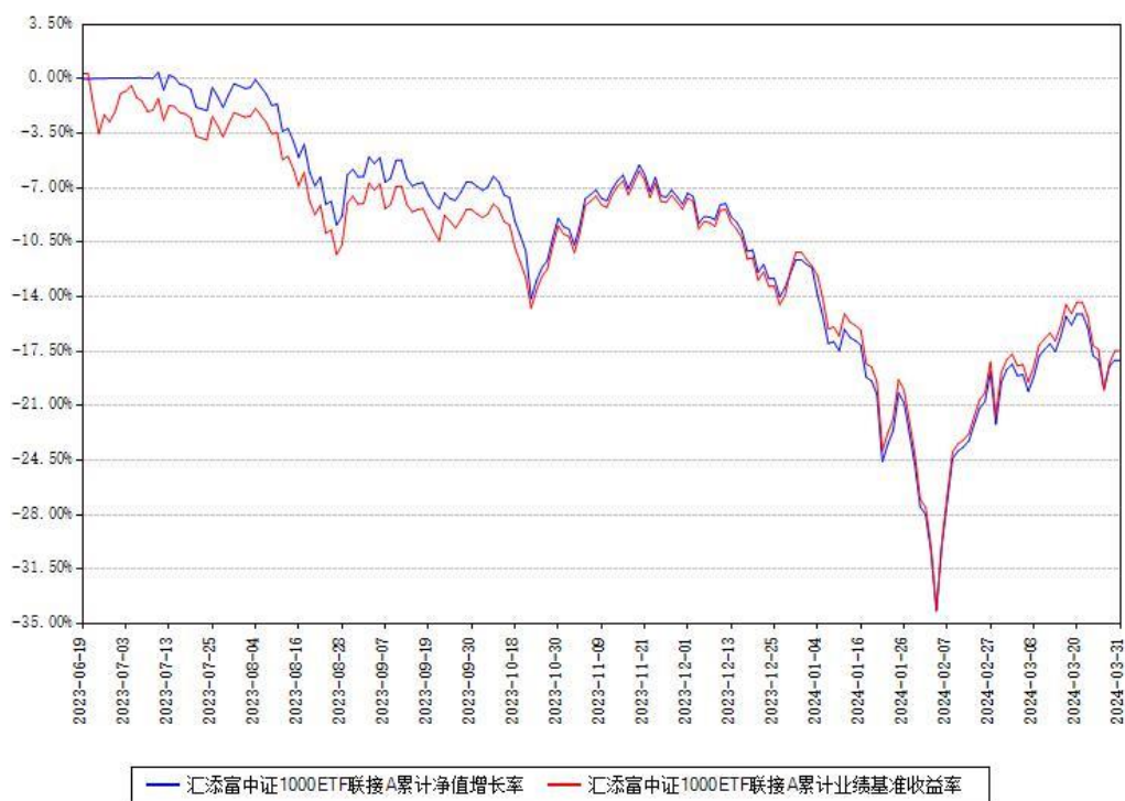
汇添富中证1000ETF联接A累计净值增长率与同期业绩基准收益率对比图