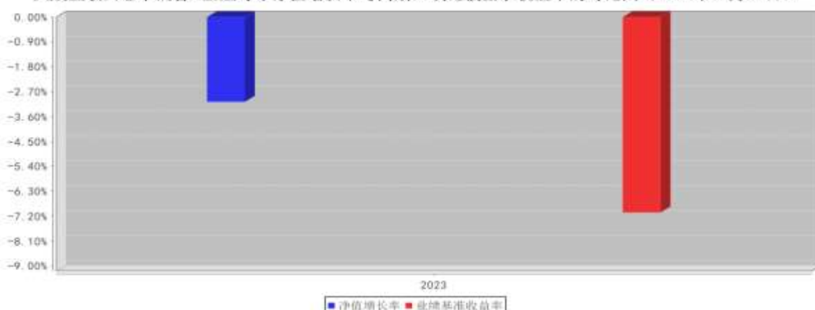
大成互联网思维混合C基金每年净值增长率与同期业绩比较基准收益率的对比图（2023年12月31日）