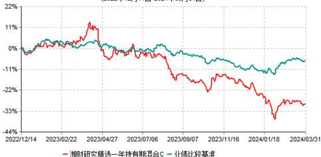
湘财研究精选一年持有期混合C累计净值增长率与业绩比较基准收益率历史走势对比图 (2022年12月14日-2024年03月31日)