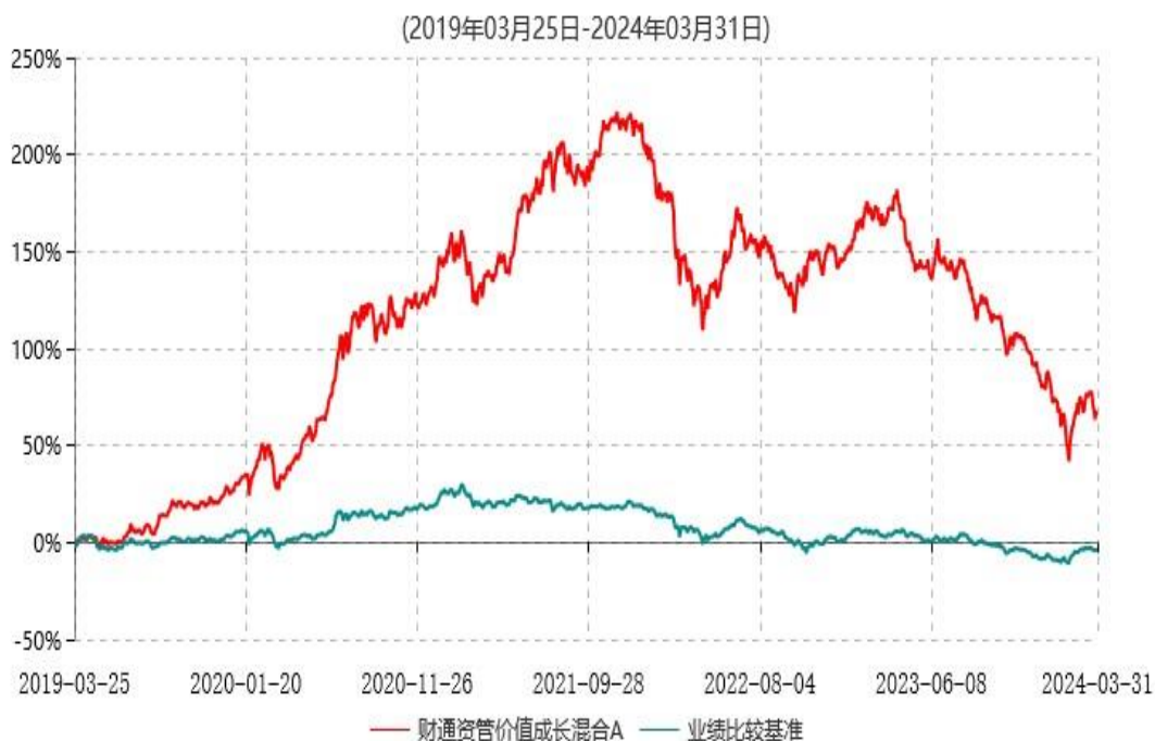
财通资管价值成长混合A累计净值增长率与业绩比较基准收益率历史走势对比图