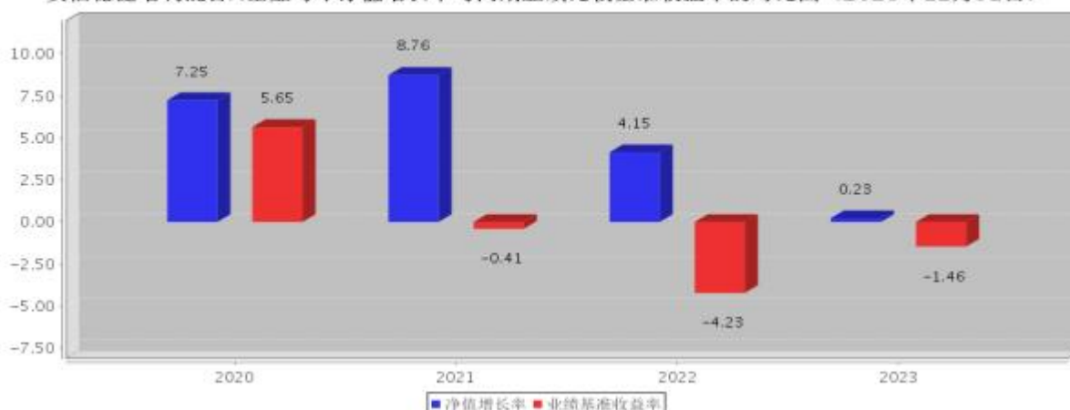
安信稳健增利混合A基金每年净值增长率与同期业绩比较基准收益率的对比图（2023年12月31日）

注：基金合同生效当年期间的相关数据按实际存续期计算。基金的过往业绩并不代表其未来表现。