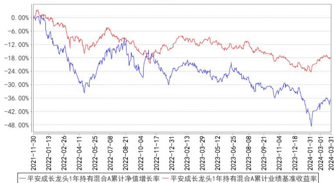
平安成长龙头1年持有混合A累计净值增长率与同期业绩比较基准收益率的历史走势对比图