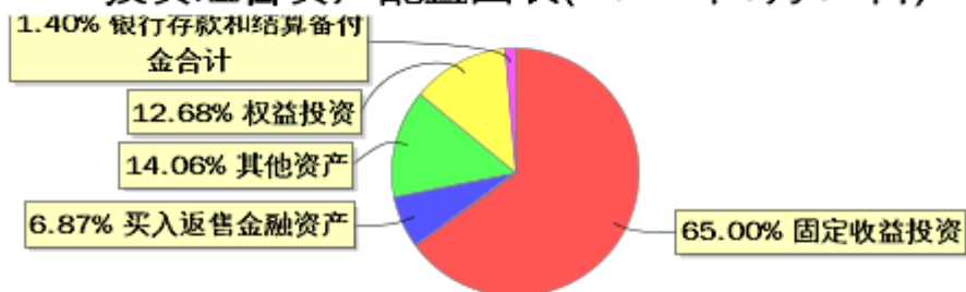
投资组合资产配置图表(2024年3月31日)

● 固定收益投资 ● 买入返售金融资产 ● 其他资产 ● 权益投资 ● 银行存款和结算备付金合计