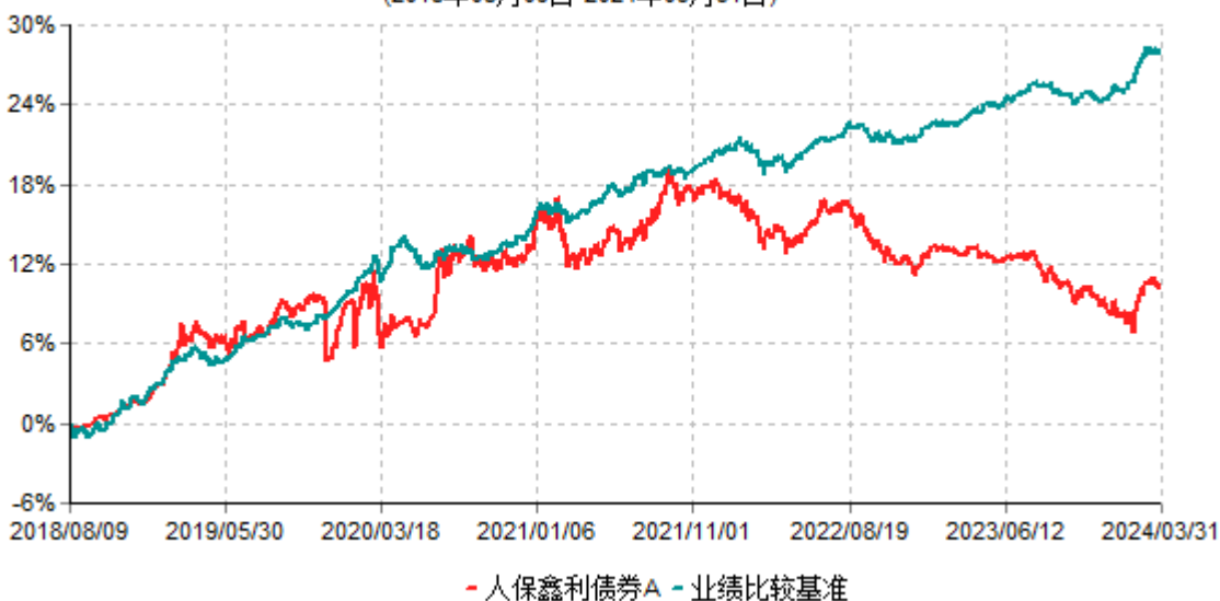
人保鑫利债券A累计净值增长率与业绩比较基准收益率历史走势对比图 (2018年08月09日-2024年03月31日)