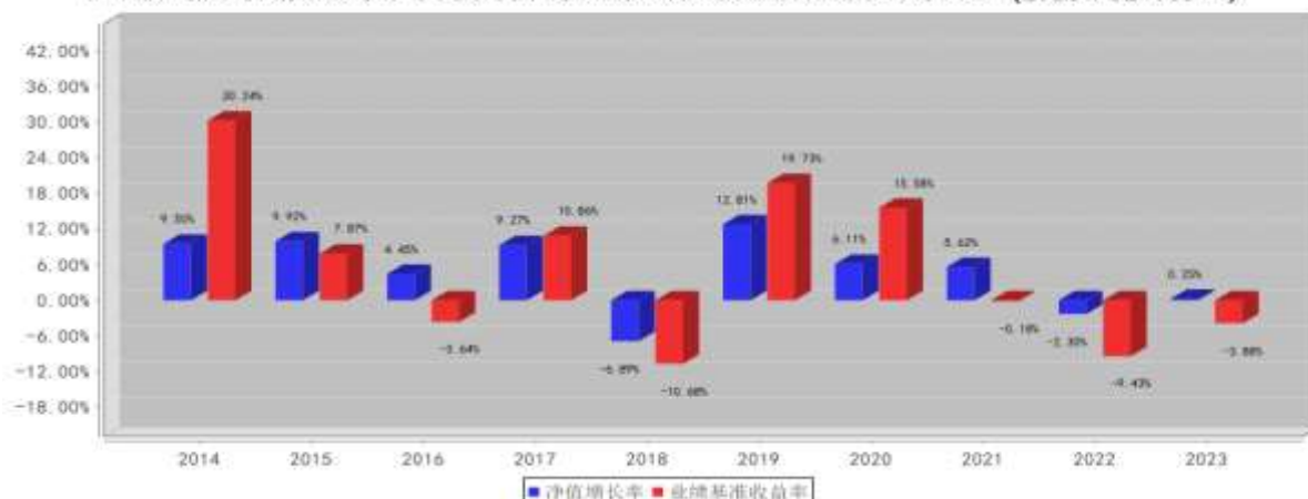
国联安通盈混合A基金每年净值增长率与同期业绩比较基准收益率的对比图（2023年12月31日）