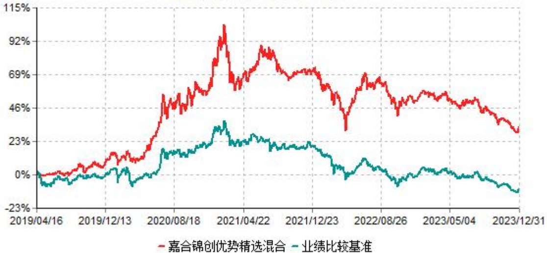
嘉合锦创优势精选混合型证券投资基金累计净值增长率与业绩比较基准收益率历史走势对比图 (2019年04月16日-2023年12月31日)