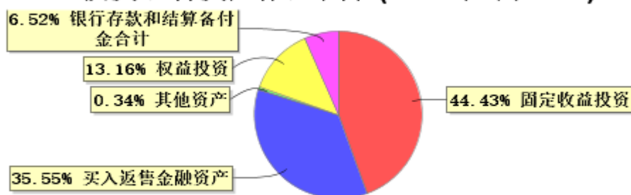
投资组合资产配置图表(2024年3月31日)

● 固定收益投资 ● 买入返售金融资产 ● 其他资产 ● 权益投资 ● 银行存款和结算备付金合计