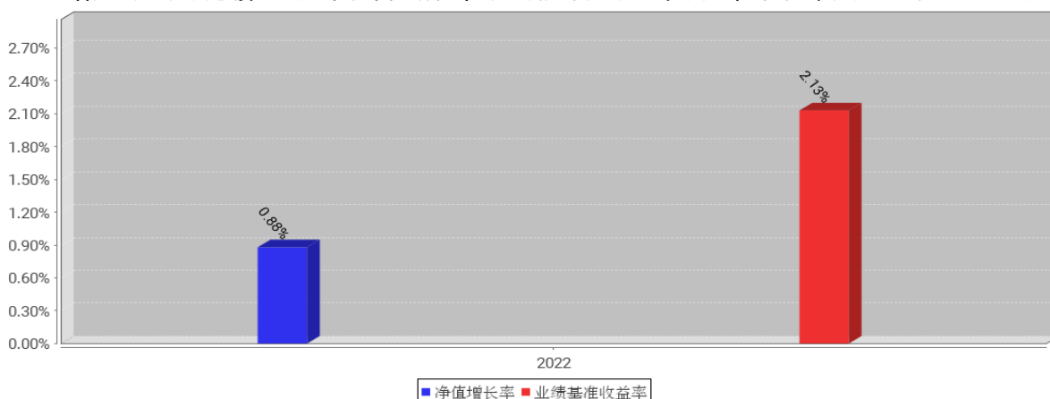
工银瑞恒3个月定开债券A基金每年净值增长率与同期业绩比较基准收益率的对比图（2022年12月31日）

注：1、本基金基金合同于2022年4月20日生效。合同生效当年不满完整自然年度的，按实际期限计算净值增长率。