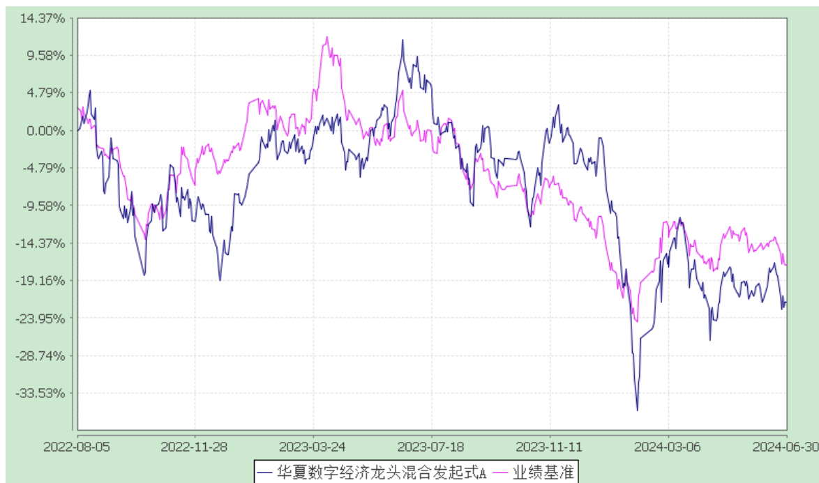
华夏数字经济龙头混合发起式 C: