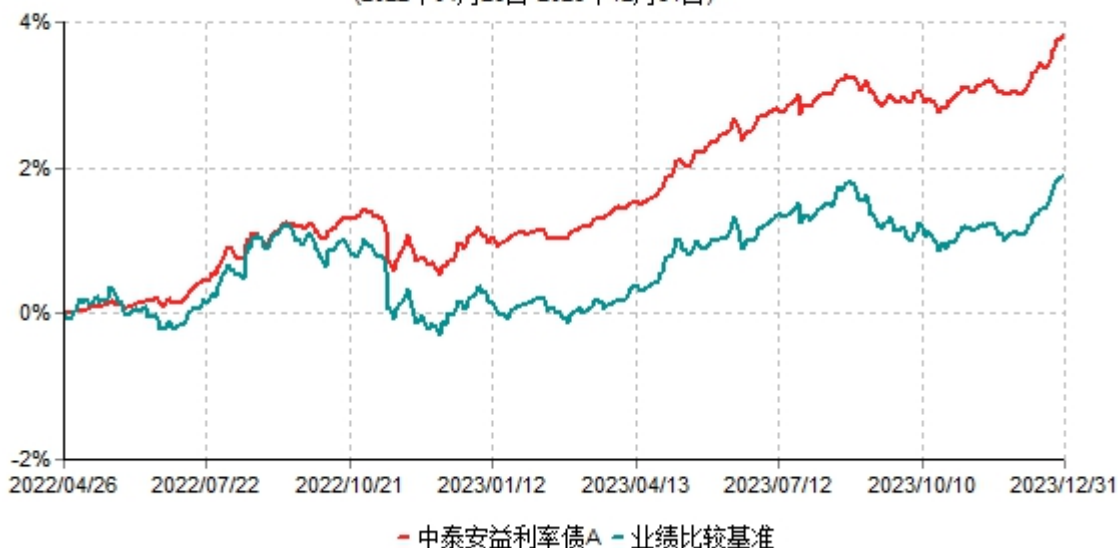
中泰安益利率债A累计净值增长率与业绩比较基准收益率历史走势对比图 (2022年04月26日-2023年12月31日)