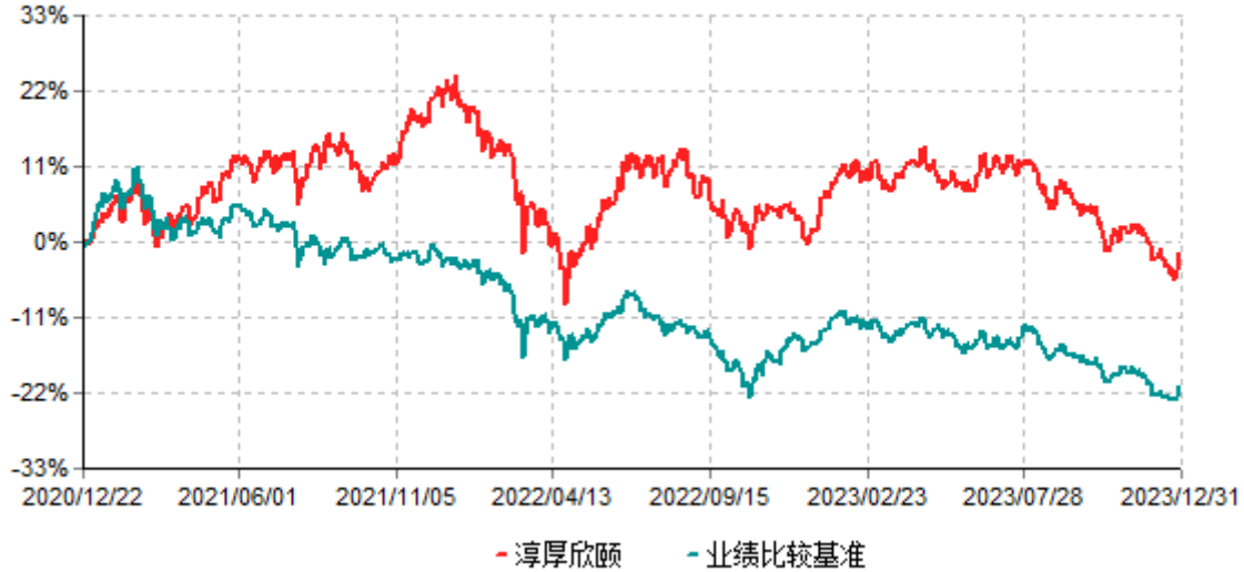
淳厚欣颐一年持有期混合型证券投资基金累计净值增长率与业绩比较基准收益率历史走势对比图 (2020年12月22日-2023年12月31日)

注：本基金基金合同生效日为2020年12月22日。按基金合同规定，本基金自基金合同生效起6个月内为建仓期。建仓期结束时本基金的各项投资比例均符合基金合同约定。