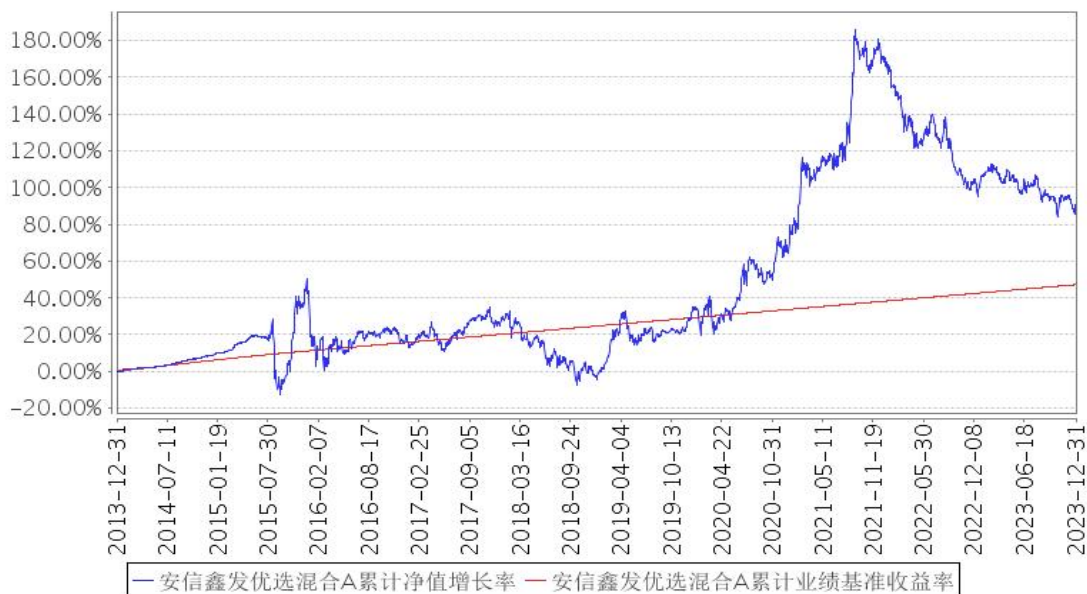
安信鑫发优选混合A累计净值增长率与同期业绩比较基准收益率的历史走势对比图